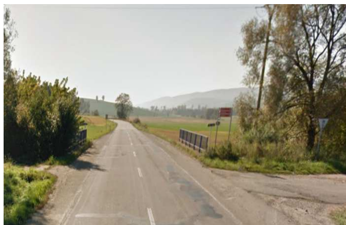
Stav při rekonstrukci