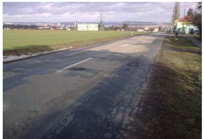
Stav po opravě