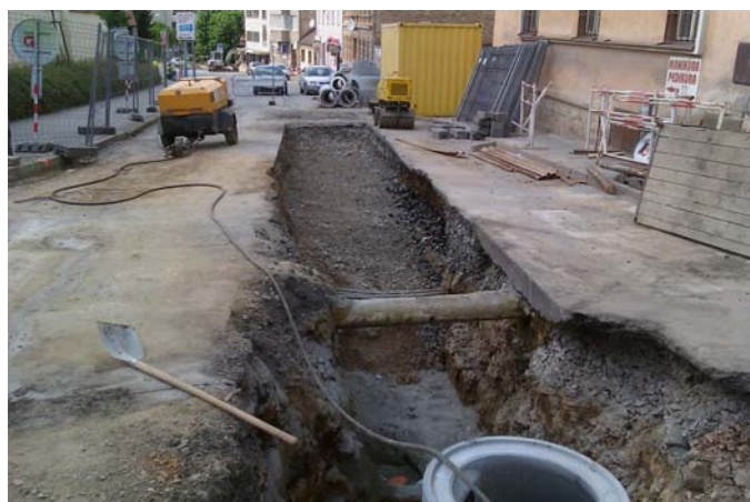
Stav po rekonstrukci – II/150 ul. kpt. Jaroše