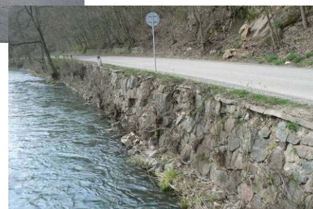
Rekonstrukce opěrné zdi