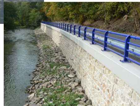
Rekonstrukce opěrné zdi