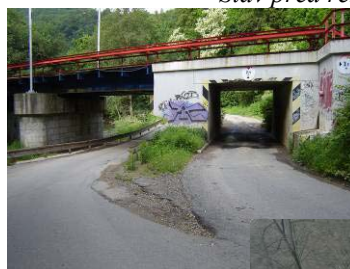
Podjezd pod tratí