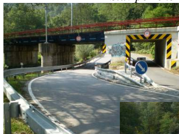
Podjezd pod tratí