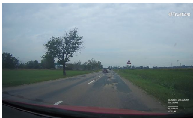
Stav po rekonstrukci SO 105 úsek silnice v k.ú. Ladná