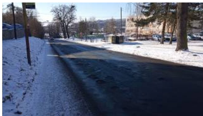
Stav po rekonstrukci