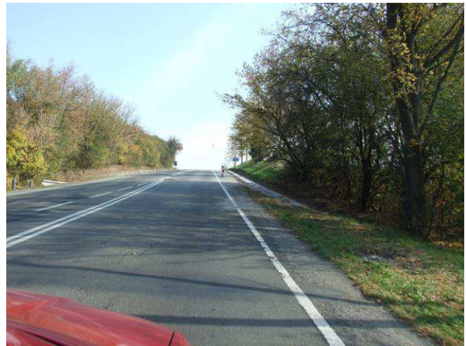
Stav po rekonstrukci