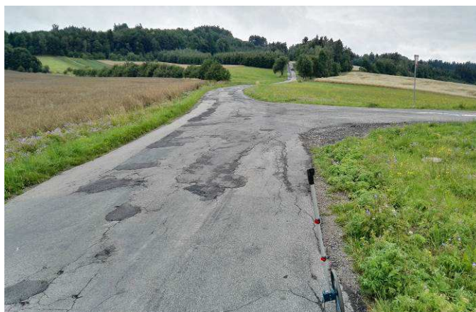
Stav po rekonstrukci